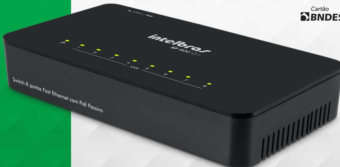
Switch Fast Ethernet